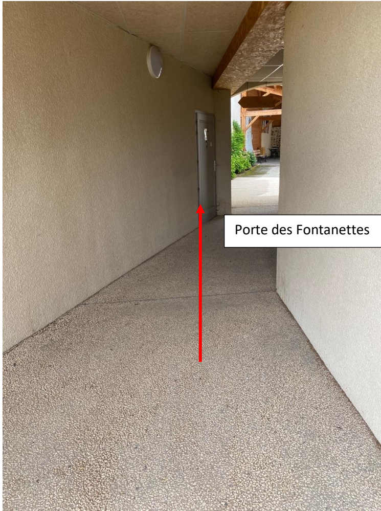
Porte des Fontanettes